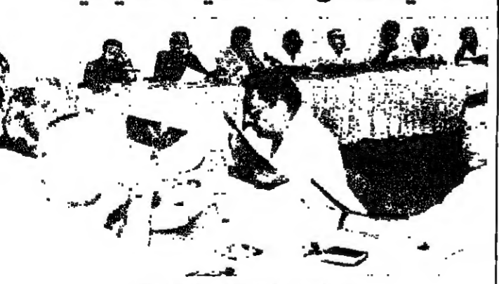
اجتماع الهيئة العامة لقضاء جيبيل